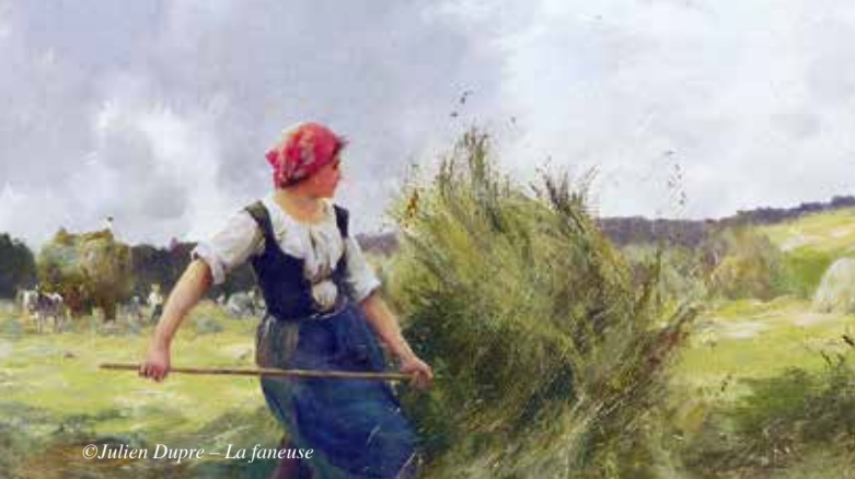
© Julien Dupré - La faneuse

DIMANCHE 4 JUIN À 9H30 ET 14H LECTURE DE PAYSAGE